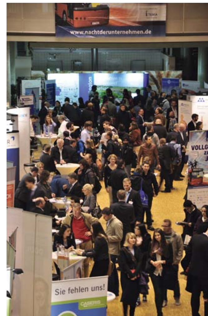
Banenmarkt Jobmesse „Nacht der Unternehmen“