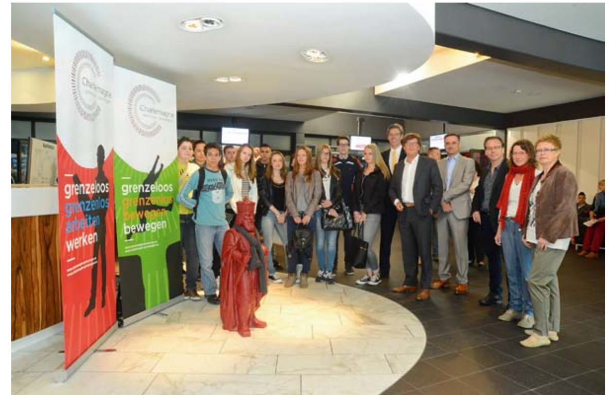
Deelname aan de ZAB 2014 Teilnahme an der ZAB 2014

Im Rahmen von grenzüberschreitenden Unternehmertreffen soll die Wirtschaft über spezifische Entwicklungen und Möglichkeiten in der Grenzregion informiert werden. Diese Treffen richten sich insbesondere an klein- und mittelständische Betriebe und werden im Wechsel an verschiedenen Orten in der Grenzregion organisiert. 2014 fanden Treffen auf belgischer Seite der Kooperation, veranstaltet mit Unterstützung der WFG Ostbelgië und mit den niederländi-