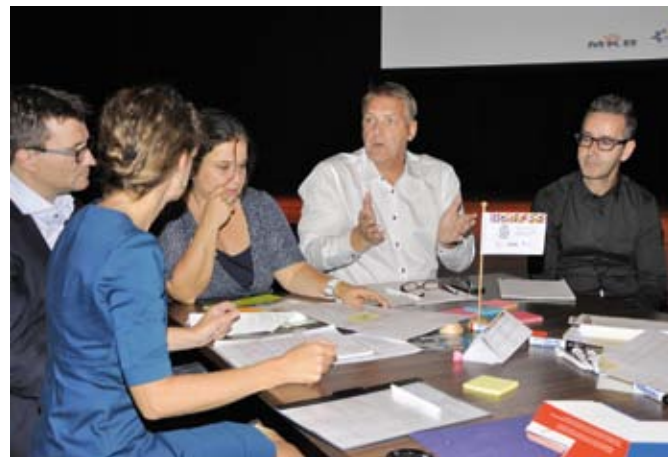
Ondernemersbijeenkomsten 2014 Unternehmertreffen 2014

Geïnspireerd door het bestaande project "Week van de mobiliteit" werd in 2014 voor het eerst een beleidsuitwisseling georganiseerd. Hoewel de organisatie ervan tamelijk veel werk kost, is deze uitwisseling van groot belang omdat hiermee een doelgerichte uitwisseling tot stand komt tussen de beleidsmakers van de Charlemagne-partners die verantwoordelijk zijn voor de voor Charlemagne relevante werkvelden. Aan het begin van het jaar kon een groot aantal ambtenaren een kijkje nemen in de keuken van hun collega's in het buurland. Charlemagne Grensregio zorgt daarmee voor grensoverschrijdend contact tussen beleidsmakers. Door deze manier van netwerken hoopt Charlemagne een steentje bij te dragen aan betere informatie-uitwisseling over politieke ontwikkelingen.