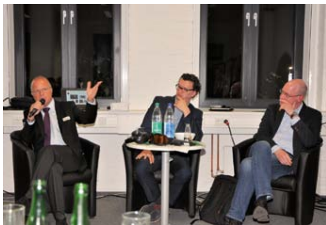
Charlemagne detailhandelforum Charlemagne-Einzelhandelsforum

Im November präsentierte sich die Charlemagne Grenzregion wieder bei den Newcomer Days der Stadt Aachen. Mit 1600 Besuchern hat sich diese Willkommens- und Informationsbörse zur Region bereits jetzt etabliert. Ausgestattet mit einem neuen Messestand, der zum Teil mit Interregmitteln