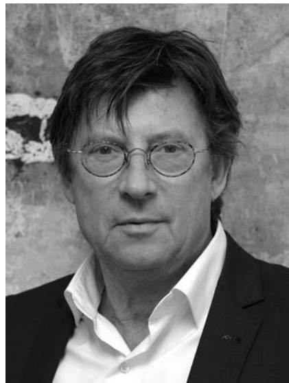
↗ Jos Som Bürgermeister der Stadt Kerkrade Burgemeester Kerkrade