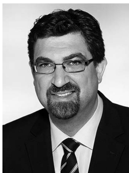
↓ Reg van Loo Bürgermeister der Gemeinde Vaals Burgemeester Vaals