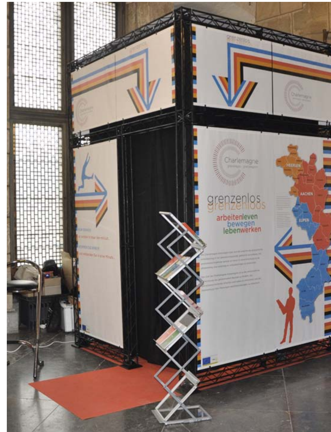
Nieuwe beursstand Neuer Messestand